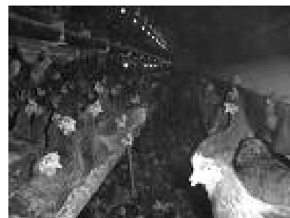
Figure 2. Volière.